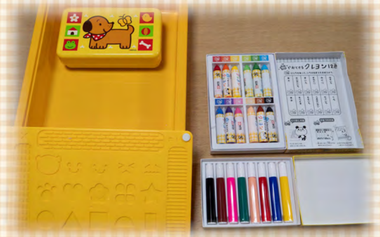
3・4・5歳児 個人持ち教材