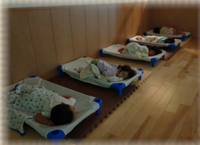
1・2・3歳児 午睡の様子 ハンモック型ベッドを使用しています