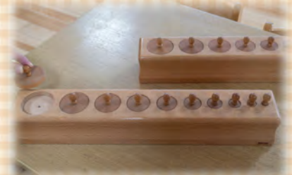
モンテッソーリ教具の一例