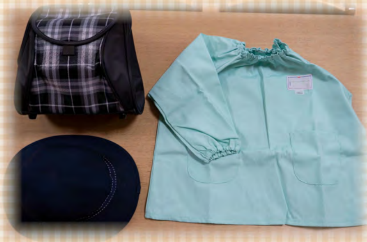
3・4・5歳児 冬用スモック 園指定のリュック・帽子